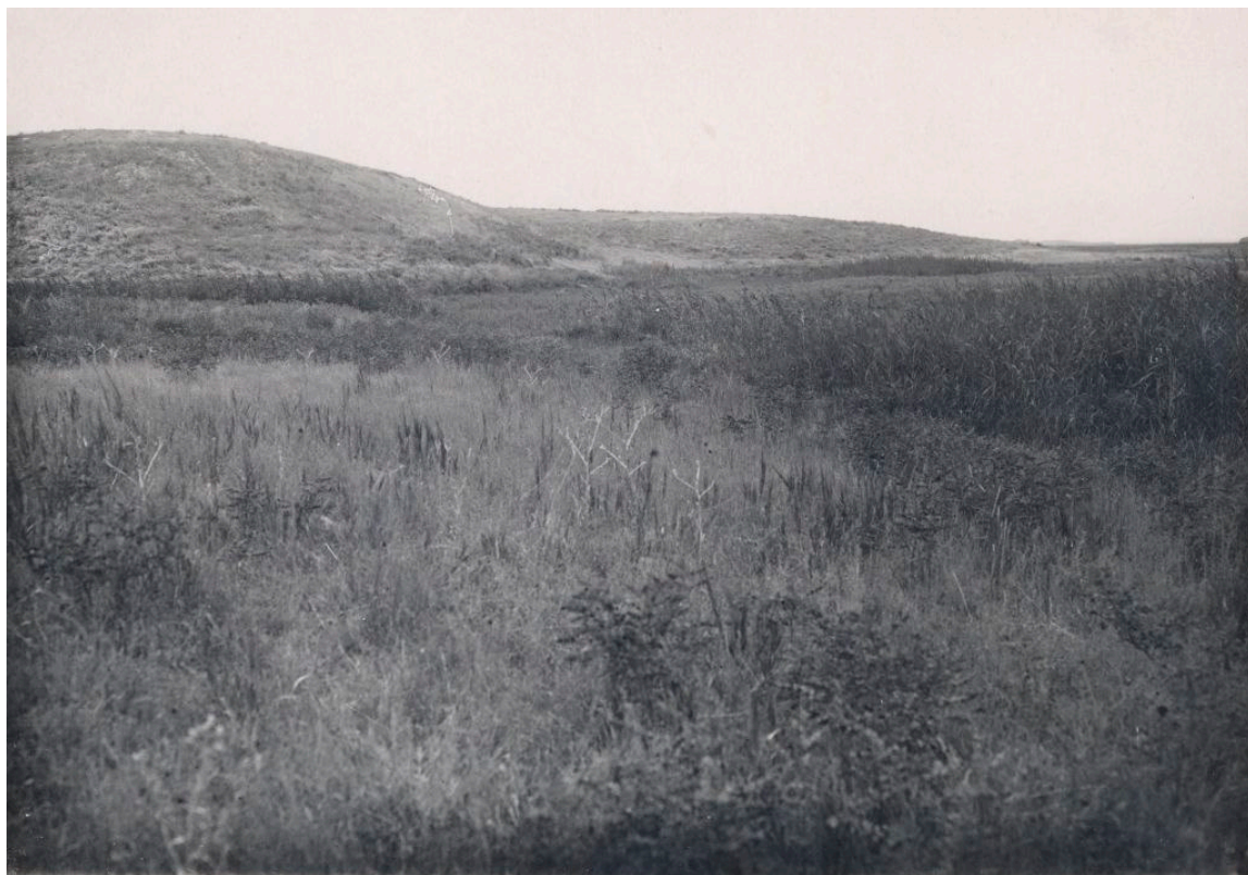
13-сурет. Цитадель мен қамалдың солтүстік қақпасы. С.Луговое. 1936 жыл. (ФМ О. 1259.38)

құрайды деп санап, оларды «шулық қалашықтар кешендері» деп атайды [140, с. 69].