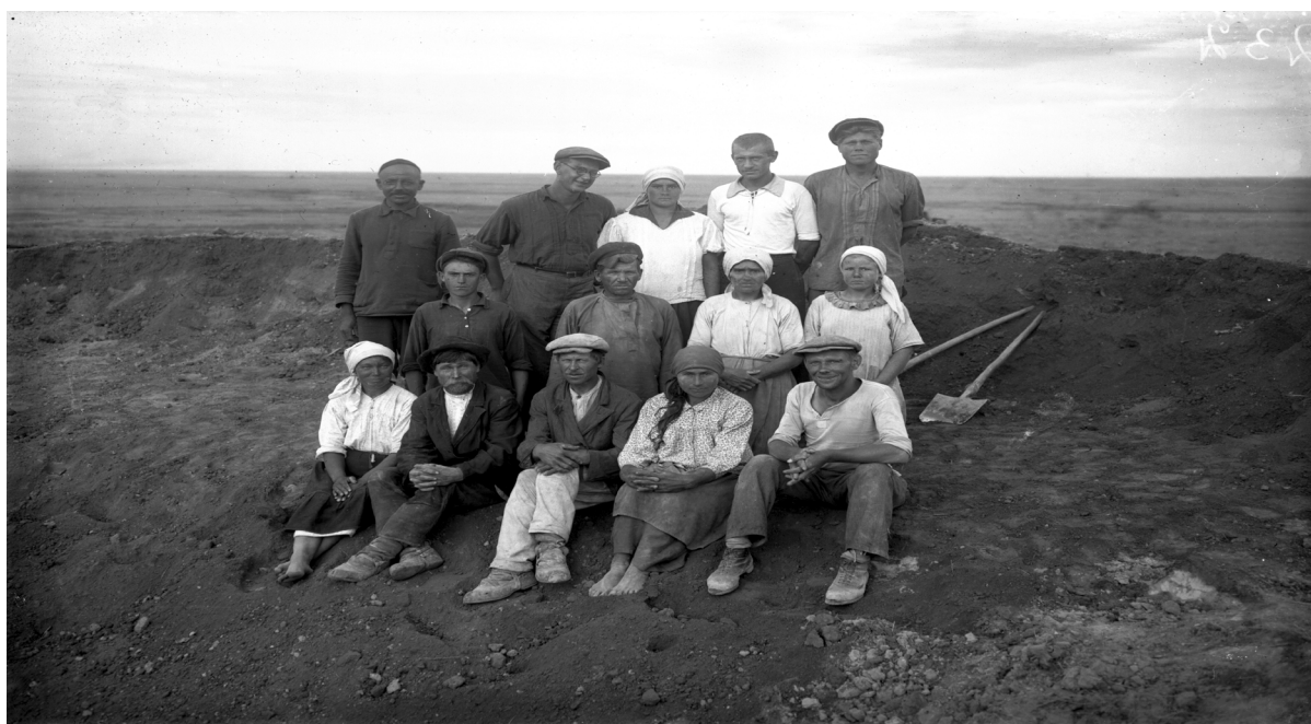
11-сурет. А.Н. Бернштам қазба барысында. (ФМ, II 28458. О-1259-36)

Жамбыл археологиялық пункті экспедициясы 1940 жылы Жамбыл қаласынан 12-13 шақырым оңтүстік-шығысқа қарай қызылша совхозы маңында орналасқан Төрткүл қалашығына зерттеу жұмыстарын жүргізеді. Бұл қала орны ортағасырлық Төменгі Барысхан қаласымен баламаланған болатын. Қала жоспары бойынша төрт бұрышты ұзындығы 310 м, ені 140 м. Қалада қазба жұмыстары жүргізілмеген, тек жер бетінде жатқан материалдар жинақталған [129, с. 132].