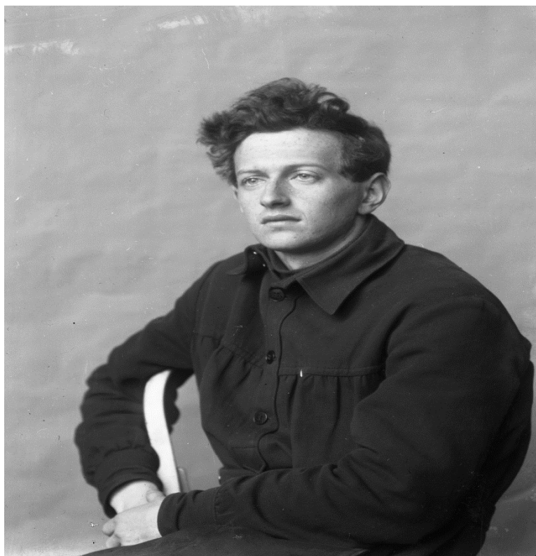
1-сурет. А.Н. Бернштам ММТМА аспиранты. 1931 ж. (ФМ,альбом О.292, негатив I-849)

1931 жылдың шілде айында Ленинград Мемлекеттік университетінің жанындағы Тарих-лингвистикалық институтының этнограф-мұражайтанушы мамандығы оқуын аяқтайды.