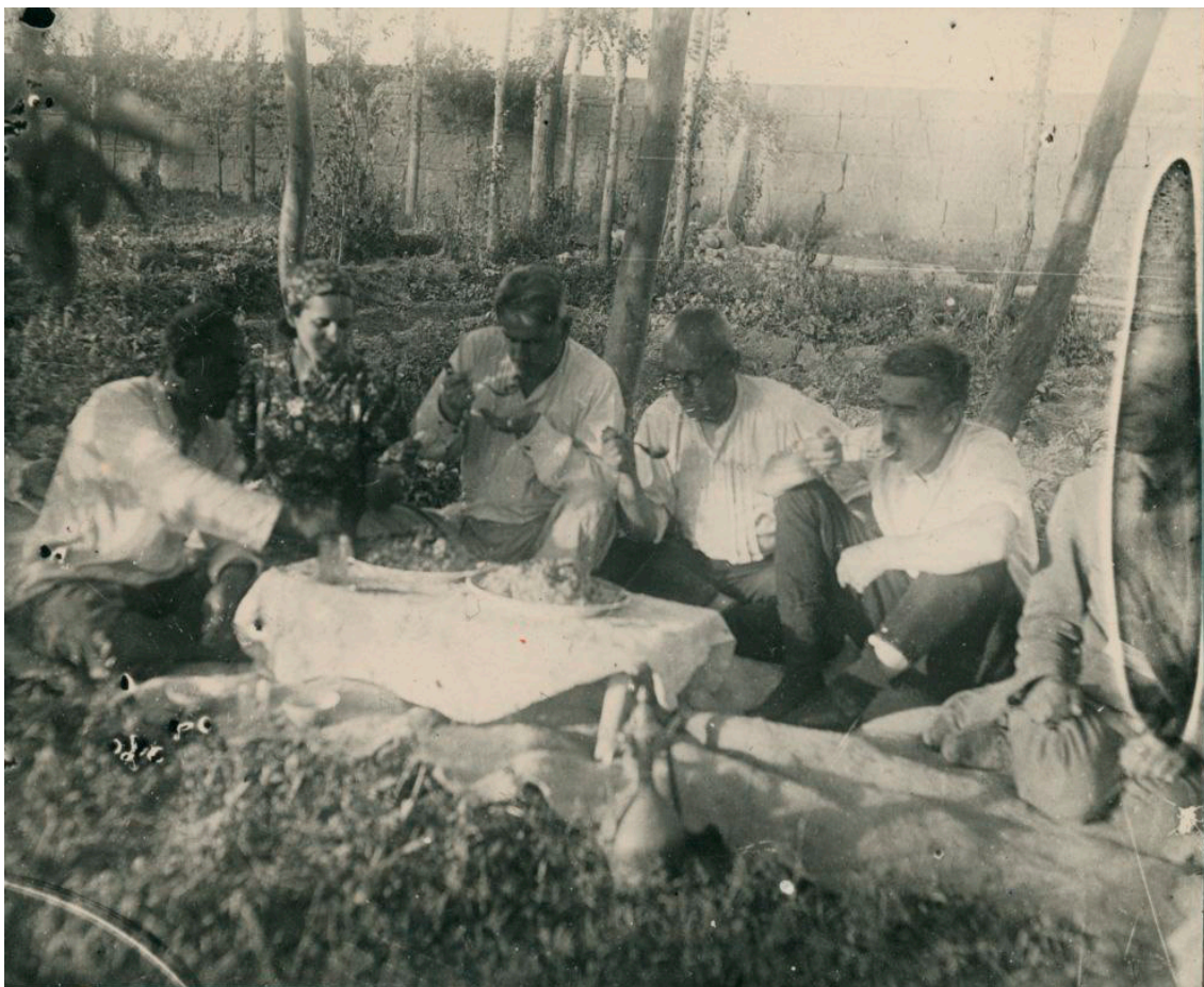
10-сурет. Жұмыскерлер демалыс күні. 1936 жыл. (ФМ, О -1510.38)

Дегенмен, Тараз қаласы әлі де біраз уақыт өмір сүргенінің дәлелі ретінде жұқа мәдени қабаттың табылуын көрсетеді.