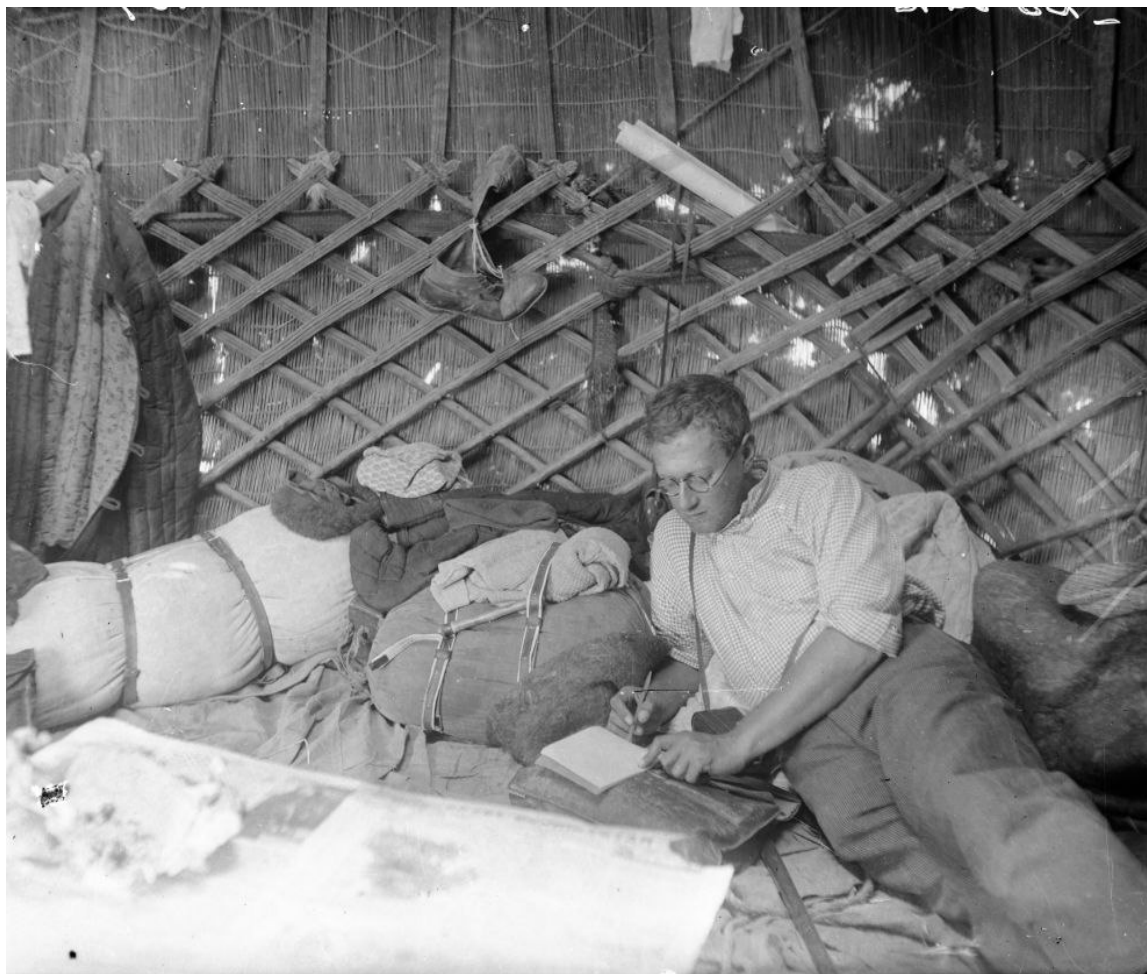
7-сурет. А.Н. Бернштам кезекті экспедиция материалдарын қағаз бетіне түсіруде. (ФМ, О.1855)

жазықтарын қамтыды. Осы Алабука атырабын зерттеп бастағаннан-ақ, Тянь-Шанның Ферғана мен Алаймен байланысы байқалады (7-сурет).