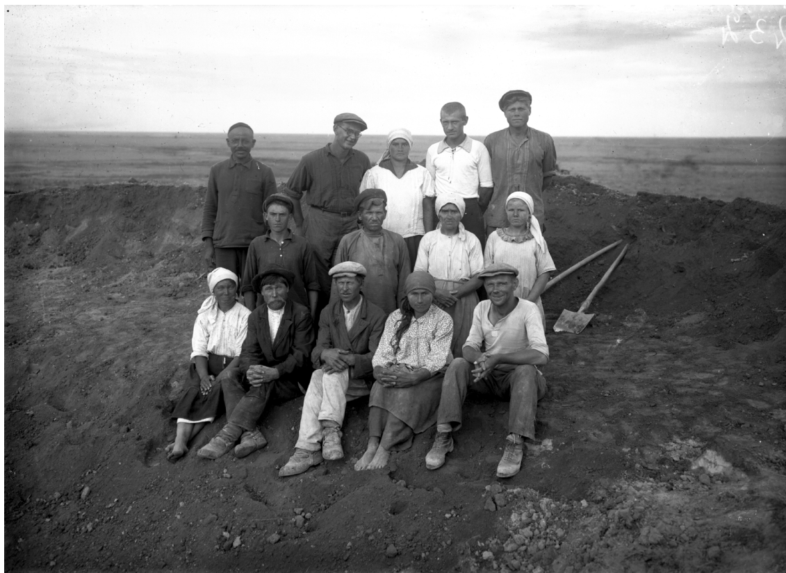
14-сурет. Луговое қамалындағы қазба жұмыскерлері. 1936 жыл. (ФМ, П-43498)

ежелгі 4 фарсах өлшемге теңдігі, үшіншіден, қала жұрттың өзіндік ерекшелігімен түсіндіріледі.