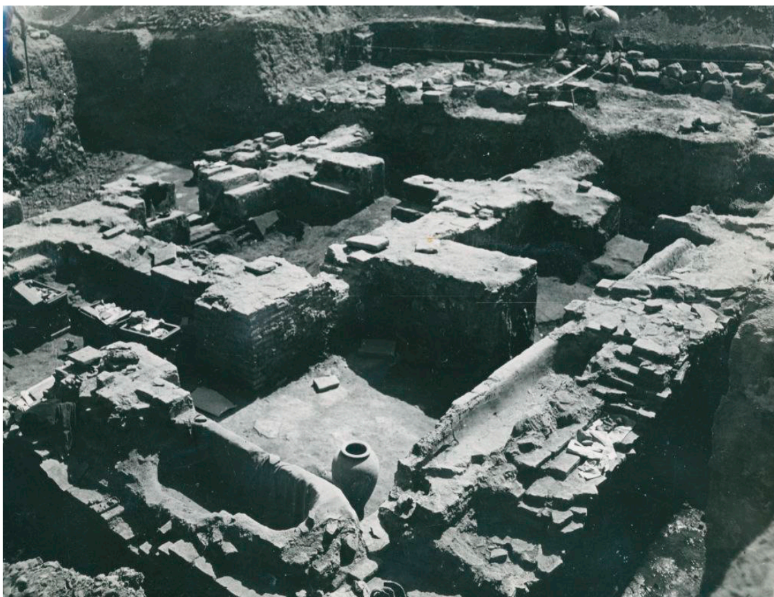
8-сурет. Ежелгі Тараз №2 қазба – моншаның ОБ-СШ жалпы көрінісі. 1938 жыл. ҚазКСР. 1936 жыл. (ФМ, О.150859)

Құрылыс көп куполды, әр бөлменің өз куполы болған. Әр куполдың орташа радиусы шамамен 1 метр шамасында. Әрбір купол ішкі жағынан сыланған және қара, көк және қызыл түспен өрнектелген. Ғалым жалпы монша құрылысынан қабырғаның 0,45 метрден 1 метрге дейінгі төменгі бөліктері, кірпіштен тізілген едені және қабырғаның жалғасы іспеттес жерге 0,60-0,78 м шамасында кіріге салынған іргетасы ғана сақталғанын айтып өтеді, моншаға кіре беріс солтүстік қабырғада орналасқан [99, 155 п.].