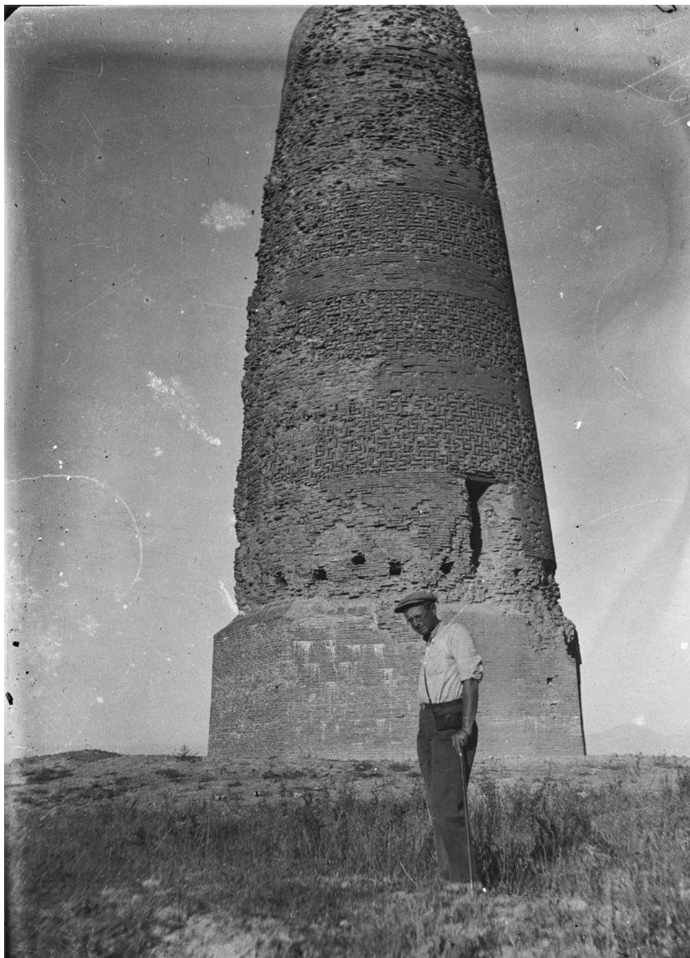
12-сурет. Бурана қаласы. Мұнара. 1938 ж. (ФМ, П-28372)

Ақбешімде кеңейтілген археологиялық зерттеу жұмыстарын жүргізеді. Осы зерттеулер нәтижесінде Л.Р. Кызласов В.В. Бартольд пен А.Н. Бернштамның ортағасырлық Баласағұн қаласын Ақбешіммен баламалауға негіз жоқтығын айта келіп, «Исторический Баласагун – блестящая столица караханидов XI-XII вв., город просуществовавший, согласно письменным источникам, вплоть до XIV в., надо искать в другом месте» деген қорытындыға келеді [60, с. 23].